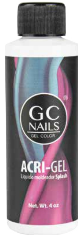
ACRI-GEL: LÍQUIDO MODELADOR SPLASH 4 OZ