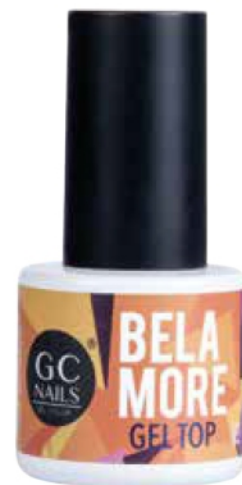
GEL TOP 10 ML