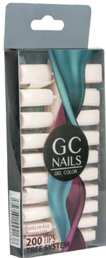
TREE SYSTEM NATURAL 100 PIEZAS