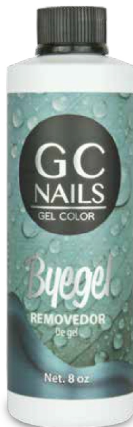
BYEGEL REMOVEDOR DE GEL CONT.NET. 8oz