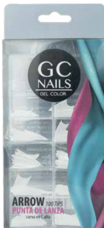
ARROW TIP PUNTA DE LANZA BLANCA 100 PIEZAS