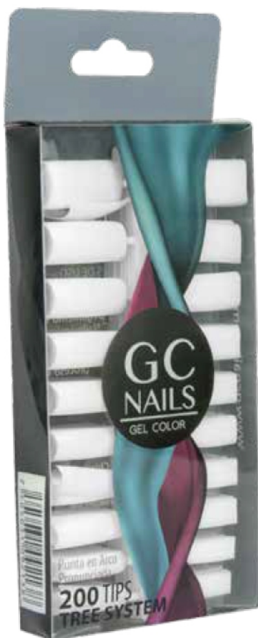
TREE SYSTEM BLANCA 200 PIEZAS