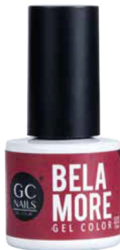
GEL DE COLOR 10 ML