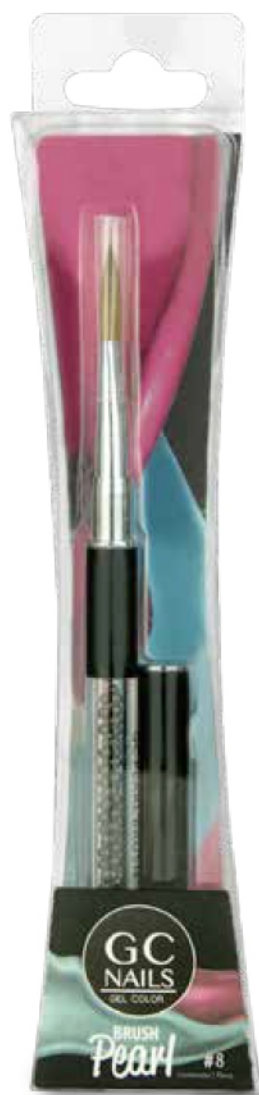
PINCEL PEARL #8