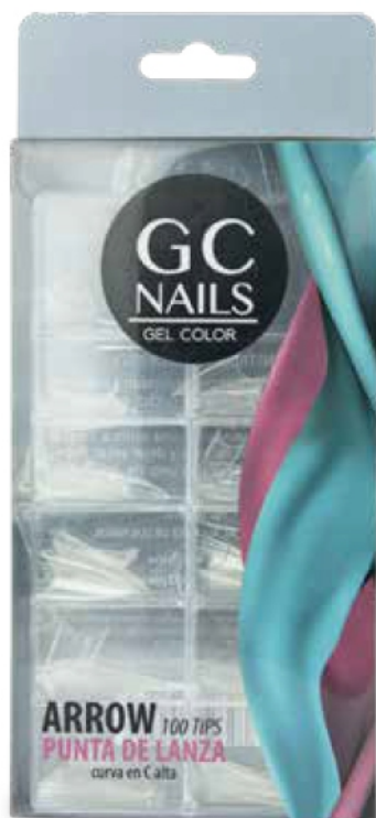
ARROW TIP PUNTA DE LANZA CRISTAL 100 PIEZAS