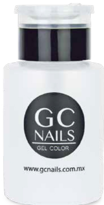
DISPENSADOR DE LÍQUIDOS