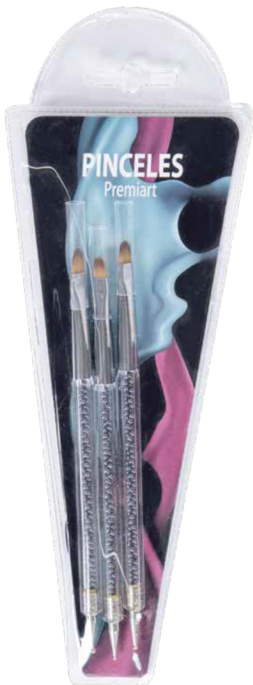
PINCELES PREMIART SET DE 3 PIEZAS