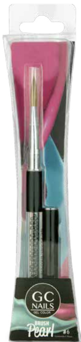
PINCEL PEARL #6