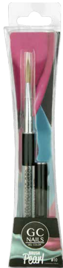
PINCEL PEARL #10