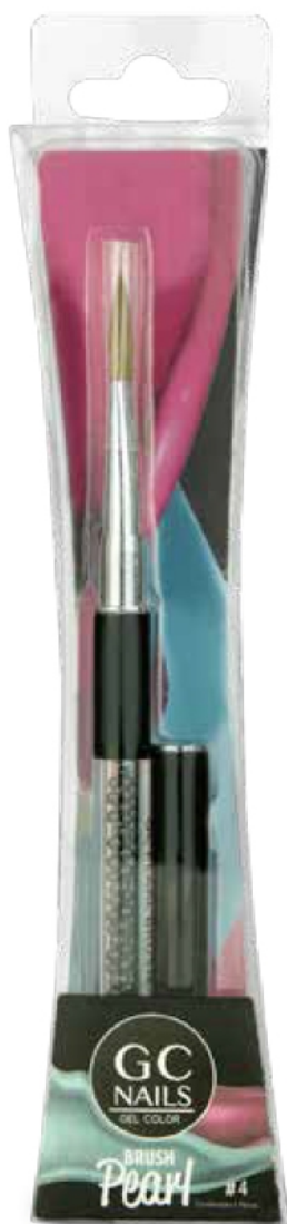
PINCEL PEARL #4