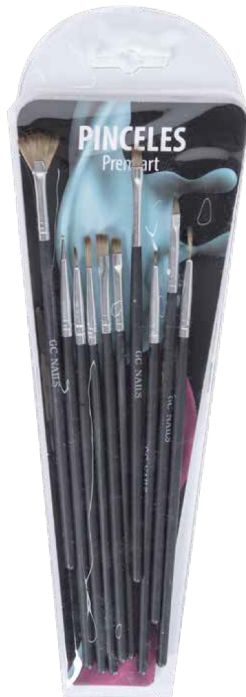
PINCELES PREMIART SET DE 10 PIEZAS