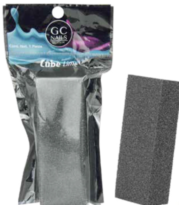
CUBE LIME BLOCK PULIDOR