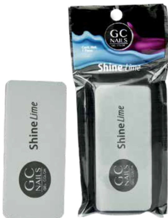
SHINE LIME ABRILLANTADOR