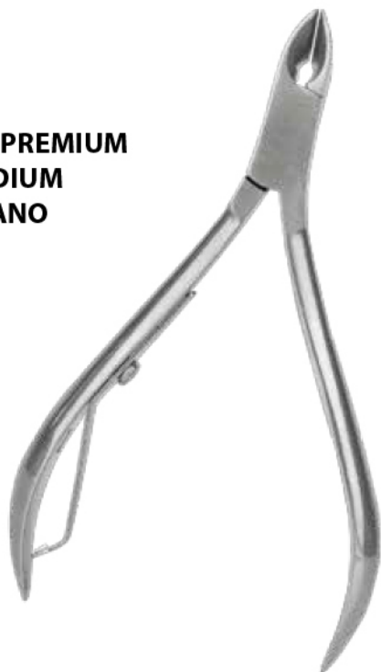
ALICATA PREMIUM MEDIUM MANO