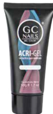
ACRI-GEL: ACRÍLICO EN GEL PARA MODELADO 50 gr