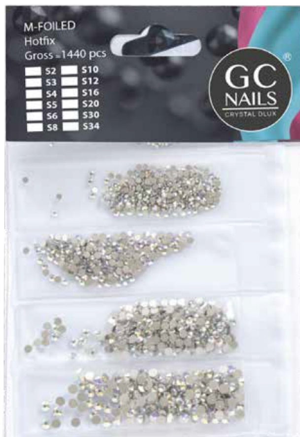
CRISTAL DELUX #4,#6, #8, #10