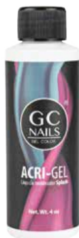
ACRI-GEL: LÍQUIDO MODELADOR SPLASH 4 OZ

6 Este líquido no se fusiona como el monómero con el acrílico, es solo para lubricar el cabello del pincel y el producto no se adhiera a este.