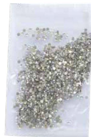
CRISTAL CLON #4,#6, #8, #10