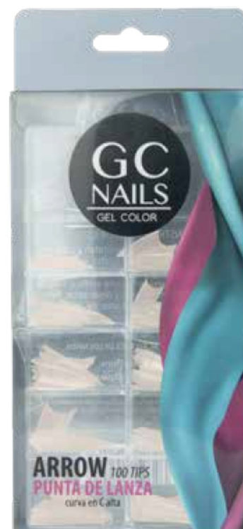
ARROW TIP PUNTA DE LANZA NATURAL 100 PIEZAS