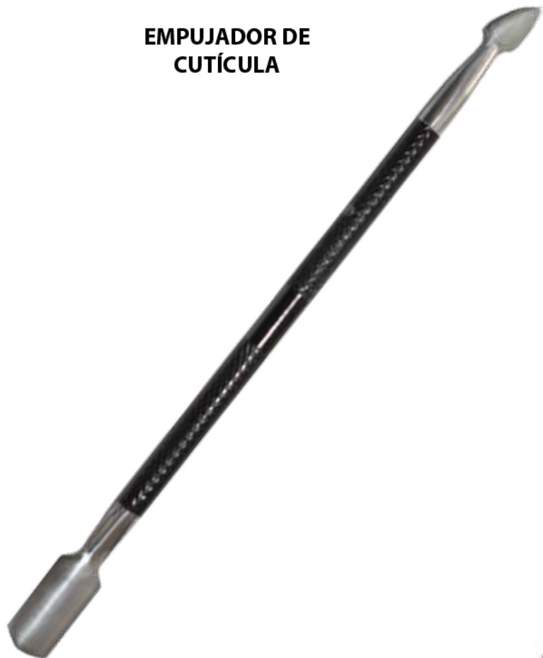
EMPUJADOR DE CUTÍCULA