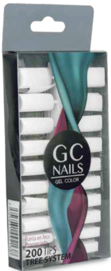
TREE SYSTEM CRISTAL 100 PIEZAS