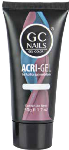
ACRI-GEL ACRÍLICO PARA MODELADO 50 g