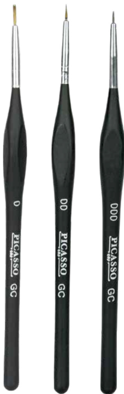
PINCELES PICASSO SET DE 3 PIEZAS