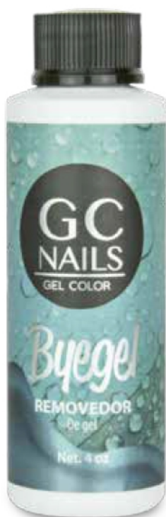
BYEGEL REMOVEDOR DE GEL CONT.NET. 4oz