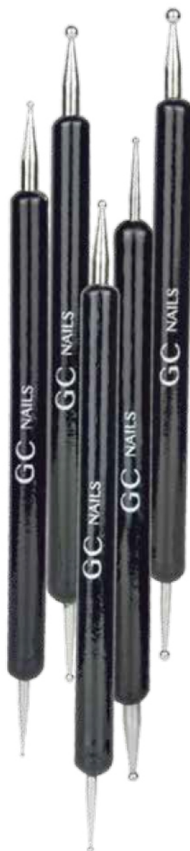
PUNTEROS ART GERMANY SET DE 5 PIEZAS