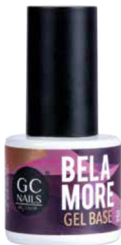
GEL BASE 10 ML